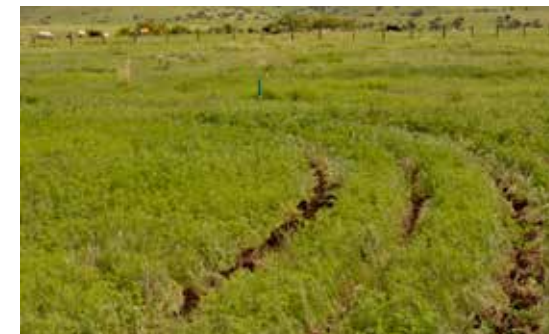
DISEÑO KEYLINE - RECARGA HIDROLÓGICA

CENTRO TIERRA SIERRA GORDA Enseñando y aprendiendo las mejores prácticas