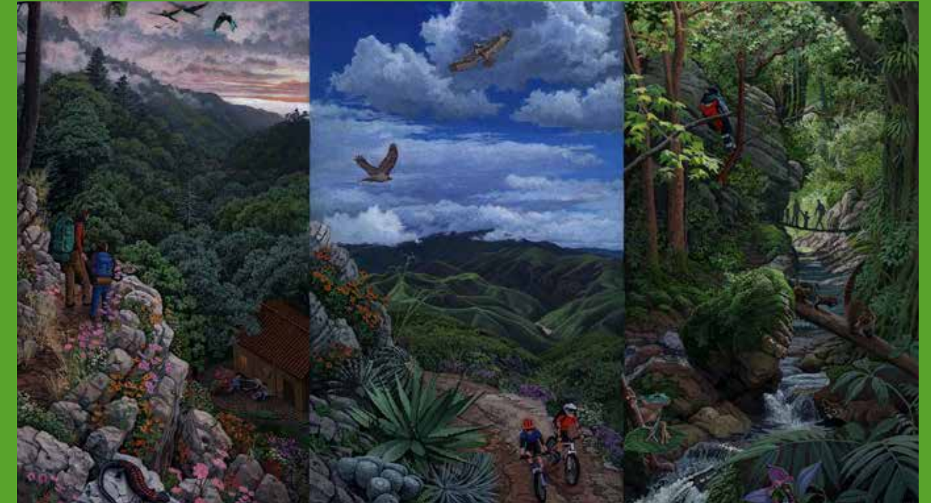
Ilustración de Ecotours en la Reserva de la Biosfera Sierra Gorda. Artista: Aslam