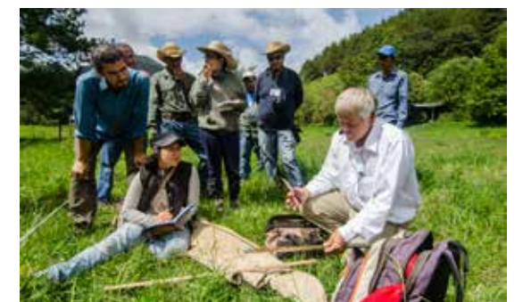
CURSOS Y TALLERES CON EXPERTOS