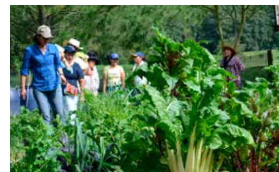
AGRICULTURA BIOINTENSIVA - SIN QUÍMICOS